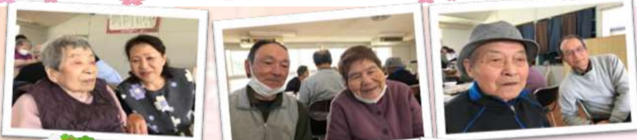
ご家族と2ショットで にっこり笑顔♪

段々と暖かくなり、青々と若葉が茂り始めた四月、あしたりグループお花見会が、上水田幼稚園跡にて開催されました。コロナ禍の影響で長らくご利用者様と職員のみとなっていたお花見会ですが、新規感染者の減少や規制緩和を受け、三年ぶりにご家族様をお招きして開催することができました。会場では仕切りのない空間で和気あいあいとした雰囲気の中、体操や歌のレクリエーション、手作りのうどんやお花見弁当を楽しみました。 食事の後は、会場の近くの桜並木を見ながら散策しました。爽やかな春の息吹の中で、家族の温かみを再確認できた素敵なお花見となりました。