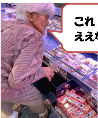
今度はジャンビー肉詰め定食を食べてみたいな。