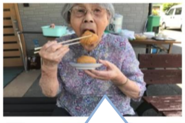
酢飯がええようにできとるわ～誰がしたん？